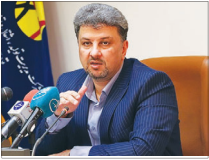
قطعی برق برنامه‌ریزی شده نداشته ایم