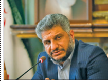
جشن «باز یافت» در اصفهان برگزار می‌شود