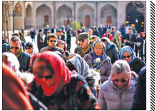
تورهای خارجی ایران را از لیست خارج کرده اند