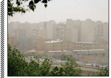
دامه گردوغبار در اصفهان تا پایان شهریور