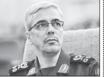
ترامپ حرف‌های بزرگ‌تر از دهش زده است

نیست، می‌تواند آن را پاره کند. آقای ما فرمودند ما هم پاره می‌کنیم، یعنی اگر این تمدی را عملی ساختند به یک چارچوب بین‌المللی در ابتدا توهین بزرگی می‌شود، اروپایی‌ها دائماً از موکراسی و از قانون و اقدام در این چارچوب‌های حقوقی صحبت می‌کردند امروز با کسی عهد بستند که دست‌آورد حقوقی و بین‌المللی‌شان را پاره می‌کنند. مشاور رئیس مجلس در ادامه اضافه کرد: برای آمریکا‌ها هم به‌عنوان یک سند بسیار زیست در صحنه بین‌الملل‌ها خواهد ماند، ما می‌توانیم در واقع یک سند رسوایی درست کنیم که آمریکا‌ها به‌عهد خود وفادار نیستند.