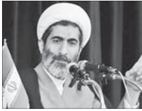
طلاق توافقی کاهش نداشته است