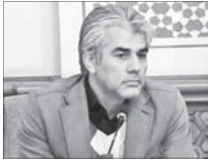
هفته جاری باران می‌بارد