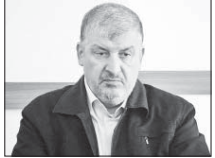
امیدوارم «ترامپ» سیفون را بکشد!