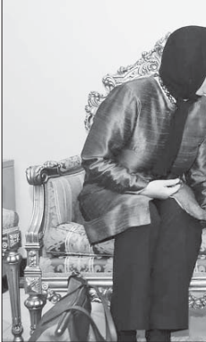
بعدی علیه ایران تصویب شد

زیر ساخت‌ها هستند این منجر شود. وی اضافه کرد: در ایران نیز گویی در زمان مسئولیت آقای لاریجانی در پرونده هسته‌ای، غربی‌ها به این بهانه که ایران پروتکل داوولپلیه و موقت را ادامه ندهد، چند قطعه‌نامه علیه ما صادر کردند در زمان مسئولیت من هم در روزی که بخش موضوع مهم مورد نظر آژانس انرژی اتمی داده شد و به تأیید آژانس هم رسید، قطعه‌نامه