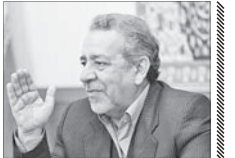
خادمان و پیر غلامان تجلیل می شوند