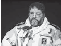
رزمایش کاشان، نماد آمادگی در مقابل حوادث است

برگزار شده است. وی افزود: در این رزمایش، دستگاه‌های خدمات رسان اعم از مخابرات، آب و فاضلاب، شهرداری، آتش نشانی برق و گاز موظف شدند، آمادگی خود را در برابر خطرهای احتمالی افزایش دهند.