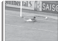
مضحک ترین گل سال به ثمر رسید!

ساختن پیش روی نداشتن اما در حالی که فاصله زیادی تا توپ داشت به شکلی عجیب و غیرمنتظره به سمت توپ شایرجه نزد و البته طبیعی بود که با این شییره نتوانست مانع از گل شدن توپ شود. حلقه‌ای بعد از دروازه بان در حالی که باز هم شانس برای جلوگیری از گل شدن توپ نداشت به سمت توپ حرکت کرد که باز هم شانس توپ را مهار نمود. کره دروازه کره شمالی با اشتباهات مضحک او بازی نمود. کره شمالی با نتیجه ۳ بر یک در این دیدار بازنده شد.