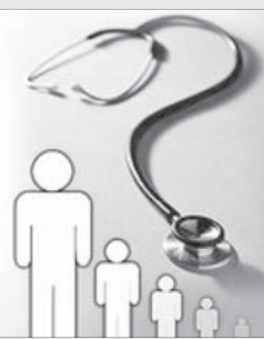
این راستا برای اطلاع رسانی بیشتر، رساله‌ها می‌توانند نقشی مؤثر ایفا نمایند.

بهره‌مند رسانی بیشتر، رساله‌ها می‌توانند نقشی مؤثر بهره‌مند شوند.