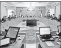
۳۰۰۰ میلیارد ریال اعتبار به دریاچه ارومیه رسید