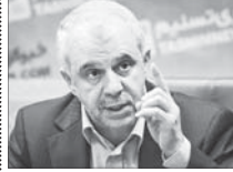
اختصاص وام به ودیعه گذاران حج

یاشگاه خبرنگاران جوان: رئیس سازمان ج و زیارت گفت: ودیعه گذاران عمره و تمتع که مبلغ ودیعه خود را در بانک ملی سپرده گذاری کرده اند، از وام یک و نیم میلیون تومانی برای تشریف به عتبات برخوردار می شوند. سید اوحدی رئیس سازمان ج و زیارت گفت: پیش از این هم کسانی که ودیعه خود را در بانک ملت سپرده بودند از این امکان برخوردار شده بودند. وی تصریح کرد که این تصمیم با توجه به محروم شدن زائران ایرانی از شرکت در مراسم تمتع گرفته شد و بر اساس این مبلغ ودیعه به عنوان ضمانت برای گرفتن وام نام درگردد.