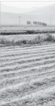
وقتی عمق فاجعه هنوز درک نشده است

زرگپور با اشاره به اینکه مهمترین مشکلات حوضه آبریز زاینده‌رود مسائل امنیتی و سیاسی است، گفت: همه باید دست در دست دهند تا طرح ۸ ماده‌ای احیای حوضه آبریز زاینده‌رود به انجام برسد و همه پیگیری‌ها باید در این چارچوب صورت گیرد.