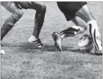
سقوط آزاد اصفهانی‌ها در لیگ برتر