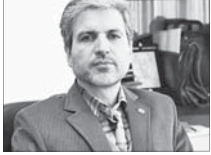
سازمان بهزیستی: متادون مورد تأیید است