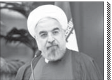
ظریف، حرف‌های نیش دار را تحمل می‌کند