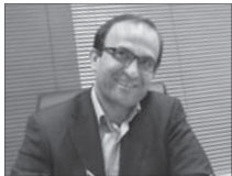
۲۰ درصد زوج های ایرانی نابارور هستند

گفت: در ایتالیا بابت وضعیت مانند ایران است و ۲۰ درصد زوج هایمان درگیر ناباروری هستند. البته در دنیا به طور میانگین ۱۰ تا ۲۵ درصد زوج ها نابارورند. مدیرعامل مجتمع دارویی و درمانی امام باقر (ع) گفت: اکنون عملاً در ایران امکان درمان بالای ۹۰ درصد زوج های نابارور وجود دارد. چوپینه درباره هزینه های درمان ناباروری در کشور، گفت: هزینه های درمان ناباروری در ایران و حتی در مراکز خصوصی یک سوم کشورهای اروپایی است. بر این اساس هزینه های درمان ناباروری در ایران بین یک میلیون و ۸۰۰ هزار تومان تا ده میلیون تومان است.