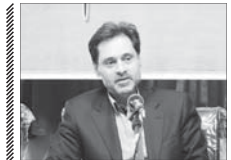
شناسایی ۱۰ هزار سالمند مجهول البویه

که تنها بوده و برای تأمین معاش خود مجبور به کار در خیابان یا پارک هستند و متأسفانه این پدیده در حال افزایش است. رئیس انجمن مددکاران اجتماعی ایران خاطر نشان کرد: نزدیک یکی از نیازهای این زنان است و نمی توانیم بگوییم این افراد بدون غذا می توانند زندگی کنند. مردم به این زنان به دلیل نداشتن کار و اینکه عموماً درگیر اعتیاد و مسائلی از این دست هستند، کمتر کمک