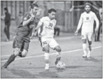
رجب‌زاده امیدوارم دربی اصفهان را ببریم