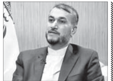
ایران و حماس اختلافی ندارند