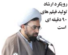
رویکرد ارشاد تولید فیلم های ۹۰ دقیقه ای است