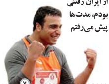
از ایران رفتنی بودم، مدت ها پیش می رفتم