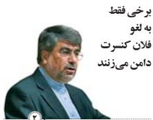
برخی فقط به لغو فلان کنسرت دامن می زنند