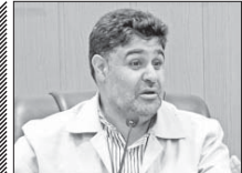
تسهیلات بدون سقف برای تعاونی‌ها

مدیر اداره حمل و نقل مسافر اداره کل راهداری و حمل و نقل جاده ای استان اصفهان از اذعان داشت: با توجه به بازسازی ۵۸۵۵ در فهرست آثار ملی ایران به ثبت رسید.