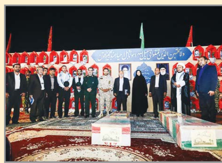
اگر امروز شاهد برقراری امنیت، استقلال و توسعه کشور هستیم حاصل مجاهدت های شهداست که اگر این شهدا نبودند مطمئناً این امر محقق نمیشد. بنابراین ثبات جمهوری اسلامی ایران، حاصل صبر و استقامت شهدا، جانبازان و ایثارگران است.

ما در قالب تهدید رخ داده است که تلاش دشمن برای عنوان خادمن حرمین شریفین، مورد احترام بودند اما امروز مرگ بر عرستان شعار عادی کشورهای عربی است و ماهیت و هایت عرستان آشکار شده است. از سوی دیگر جبهه حق طلعی جمهوری اسلامی ایران آشکار شد و مهمتر اینکه امروز نقش ولایت فقیه از بعد کار کردی بسیار مؤثر بوده و آنچه مسلم است اینکه خداوند دمه پیروزی جبهه حق در مقابل باطل را داده که جبهه حق پیروز شدنی است. ربانی می‌گوید: امروز جامعه امت اسلامی و جبهه مقاومت محدود به مردم ایران نبوده بلکه مردم مسلمان جهان را در بر می‌گیرد و ما از همه آنها حمایت می‌کنیم و از راه الهی بر پیروزی ما محقق شده است که در این میان نقش ایمان، گذشت و شهید پروری مردم بسیار مؤثر است. وی از همه برگزار کنندگان این یادواره، تشکر و قدرتی کرد.