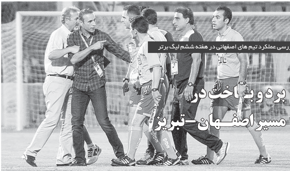
بررسی عملکرد تیم های اصفهانی در هفته ششم لیگ برتر

ورزش سه و خبر آنلاین: پس از ماه‌ها شایعه، سرانجام رئیس باشگاه العربی اعلام کرد مذاکره درآگه از این تیم جدا شد. رئیس باشگاه العربی اعلام کرد مذاکره درآگه از این تیم جدا شد. دلیل تصمیمات عجیب دو طرفی به هلال نمی‌تواند بی‌ارتباط باشد. باشگاه العربی پس از اولین برد خود در فصل جدید لیگ قطر، تصمیم گرفت تا خبر جدایی او را رسماً اعلام کند.