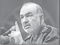
مجموعه استخوان‌های دشمن را بشکنیم

که اصول قانون اساسی پیاده شود تا عده ای برای رسیدن به قدرت به ملت دروغ بگویند. رئیس قوه قضائیه در ادامه با توجه به شرایط فرهنگی کشور گفت: اگر مسئولان فرهنگی کشور به منطبق قرآن توجه داشتند اینطور درها به روی فرهنگ بیگانه باز نمی‌شد. وی افزود: در کشور ما کتاب‌هایی چاپ می‌شود که در آن به صراحت آمده که اگر به پیش از اسلام برگردیم وضع ما بهتر است، آیا این با منطق قرآنی سازگار است؟ آیا این کتاب‌ها با نظارت وزارت ارشاد چاپ می‌شود؟