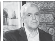
آغاز ثبت نام قطعی زائران ارمنین