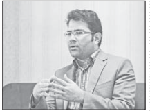
کارت زرد داوران ترافیک به تخلف رانندگان

به صورت نهمادین در تمام دهکده های امداد استان و شهر اصفهان و نیز در ۱۵ پایگاه مستقر در سطح میدان اصلی شهر برپا می شود. بهداری تصریح کرد کمک های جمع اوری شده در این مرحله تا قبل از شروع سال جدید تحصیلی به دست دانش آموزان تحت پوشش کمیته می رسد. وی در مورد مرحله دوم این جشن بیان داشت: هفتم مهرماه برای اولین بار و به صورت نهمادین، رنگ عاطفه ها در یک مدرسه از هر شهرستان نواخته و به مدت یک هفته در سراسر مدارس کشور برگزار می شود و دانش آموزان هدایای نقدی و غیر نقدی خود را اهدا می کنند.