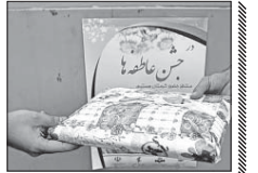
زنگ عاطفه ها، هفتم مهرماه نواخته می شود