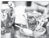
وقتی چای خارجی، استکان ایرانی‌ها را زهر آکین می‌کند

مصرف کننده از اهمیت ویژه‌ای برخوردار بوده و یکی از شگردهای جلب توجه مشترکین افروخته رنگ و اساس های مختلف به چای است: غافل از اینکه این مواد محصور از حالت طبیعی خود خارج می‌کند. این متخصص صنایع غذایی در خصوص ارتباط این مصرف بیش از حد چای خارجی با بروز انواع بیماری‌ها اضافه کرد: در چای خارجی مواد آفتکش و سموم مختلف به وفور یافت می‌شود و مصرف این محصولات آثار زیان‌باری را در درازمدت به دنبال دارد که از جمله آن می‌توان به شیوع سرطان در میان مصرف کنندگان دائمی چای‌های خارجی اشاره کرد.