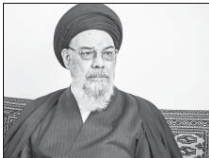
جابه جای می آمار بدبختی کشور است

تا اینجا: آیت‌الله سید یوسف طایبانی نژاد امام جامعه اصفهان گفت: ایستور نباشد که دولتی آمار می را اعلام کند، دولت بعدی باید و آمار را جسا به جا کند؛ با دولتی برای مافع آمار را درست اعلام نکند و دولت بعدی بگوید آمار دولت پیشین غلط بوده است، این بدبختی کشور است.