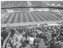
چرا جایگاه استقلال‌ها در دربی خالی ماند؟

باشگاه الاهلی قطر برای بازیکن آسیب دیده ایرانی خود، جاشین پنا کرد و یک مدافع بحرینی را جذب کرد. باشگاه الاهلی قطر برای بازیکن آسیب دیده ایرانی خود، جاشین پنا کرد و یک مدافع بحرینی را جذب کرد.