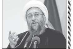
شورای نگهبان حواشی را جمع کند

انتخاب: رئیس قوه قضائیه گفت: شورای نگهبان باید خیلی حواشی جمع باشد که اصول قانون اساسی پیاده شود تا عده ای برای رسیدن به قدرت به دولت نگویند. آیت‌الله امینی لاریجانی رئیس دستگاه قضا با بیان اینکه مشکل رجوع نکردن به قرآن است، گفت: ما در این کشور کسالی را داریم که علناً حکومت دینی را نمی‌کنند اما در انتخابات نیز نام می‌کنند اینها قانون اساسی را قبول ندارند زیرا در قانون اساسی بر اصول توحید، عدل و امامت تأکید شده است. وی افزود: شورای نگهبان باید خیلی حواشی جمع باشد