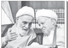
پاسخ به یک سؤال درباره این ۳ نفر