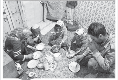
بعد از «دیوار مهربانی» ؛

در بیمارستان‌های خصوصی را تکذیب کرد. محمود بیگلر اظهار داشت: برای شفاف سازی و جلوگیری از اجحاف در حق بیماران مبادرت به ایجاد سامانه ثبتگذاری تجهیزات و ملزومات پزشکی شده که بهرجهادری از این سامانه انبساطاً توسط مراکز آموزشی و درمانی سطح کشور آغاز شده و از منی بسر درمان www.Wmedir در اختیار عموم قرار گرفته است. وی ادامه داد: همچنین تمامی مراکز درمانی کشور اعم از خصوصی، تأمین اجتماعی، خیریه و غیره صرفاً ملز