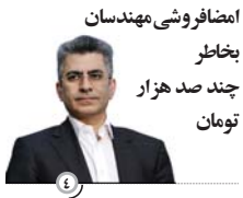
امضا فروشی مهندسان بخاطر چند صد هزار تومان