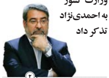
وزارت کشور به احمدی نژاد تذکر داد