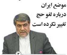
موضع ایران درباره لغو حج تغییر نکرده است