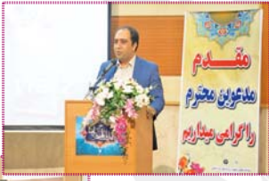
شهردار سده لنجان در آیین تجلیل از خبرنگاران

رئیس اداره فرهنگ و ارشاد اسلامی لنجان حرفه خبرنگاری را از مشاغل سخت و زیان آورند و اضافه کرد: فشارهای روحی، رفتی و استرس های شغلی در حرفه خبرنگاری یکی از مخاطرات مهم این حرفه است از این جهت باید به این عزیزان نگاه ویژه داشت. وی یادآور شد: طی دو ماه گذشته از آغاز فعالیت بنده در اداره فرهنگ و ارشاد اسلامی شهرستان لنجان بررسی های متعددی در حوزه - روابط عمومی انجام گرفت و باید گفت تشکیل تک لیکن انجمن مطبوعاتی یا مؤسسه تک منظوره در حوزه مطبوعات در این شهرستان به شدت احساس می شود چرا که این مهم می تواند کمک شایانی به رفع مشکلات این حوزه در شهرستان لنجان داشته باشد.