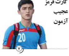
کارت قرمز عجیب آزمون