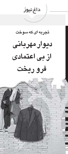
تجربه ای که سوخت

حجت‌الاسلام و المسلمین حقی تصریح کرد: مطابق قانون تومسه صحت ایرانگردی و چکانگردی تشخیصی که اقدام به مسافری و جذب مسافر و دایر کردن مراکز اقامتی غیر مجاز می‌کنند با توجه به هماهنگی صورت گرفته توسط پلیس نظارت بر اماکن نیروی انتظامی با آنان برقرورد صورت خواهد گرفت.