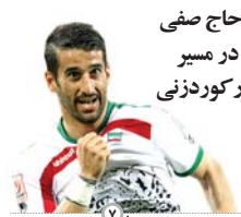
حاج صفی در مسیر رکوردزنی

نماینده اصفهان در گشتگو با اصحاب رسانه مطرح کرد