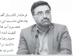
فرماندار کاشان گفت: آب شرب چاه‌های این منطقه به دلیل هجوم آب‌های شوریمی کیفیت شده است.