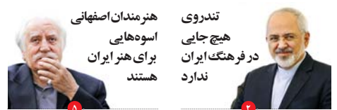
بامداد روز شنبه اتفاق افتاد

درگیری مسلحانه در سمیرم یکی از مخوف ترین باندهای سارقان مسلح در اصفهان زمین گیر شدند